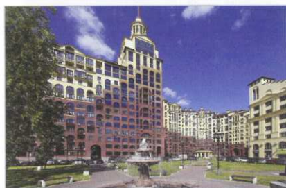
ЖК «Ренессанс», г.Москва