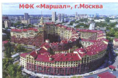
МФК «Маршал», г.Москва