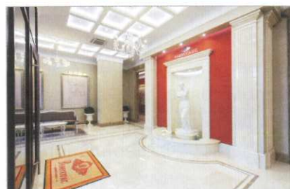
ЖК «Микрорайон Немчиновка»